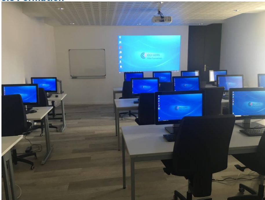
Salle de formation informatique