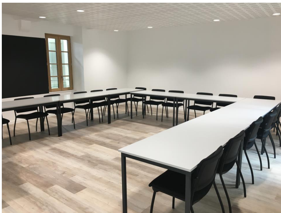
Salle de formation classique