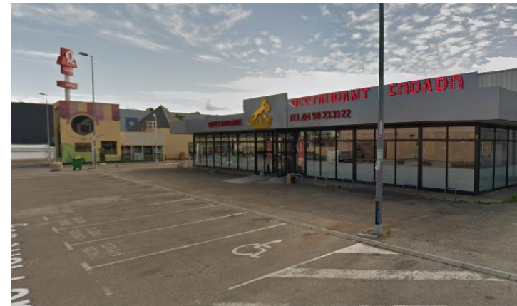
Restauration à proximité

* En cas d'accident sur le parking, CFP Formation se dégage de toutes responsabilités