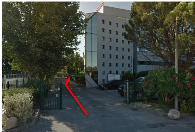
Un parking privatif et gratuit