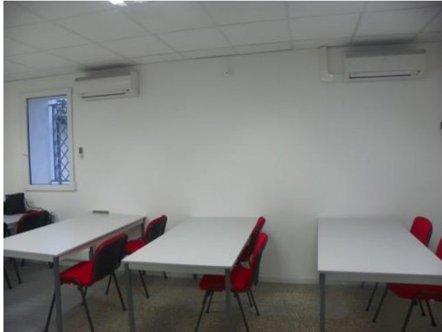
Trois salles de formation